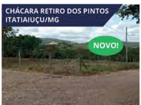
CHÁCARA RETIRO DOS PINTOS ITATIAIUÇU/MG Chácaras com 1.500,00 m 2 no Quintas do Capela Nova (Retiro dos Pintos), Itatiaiuçu/MG. R$ 105.000,00.