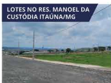
LOTES NO RES. MANOEL DA CUSTÓDIA ITAÚNA/MG Lotes em área mista para edificações residenciais e comerciais, como casas, prédios e galpões. A partir de R$ 150.000,00.