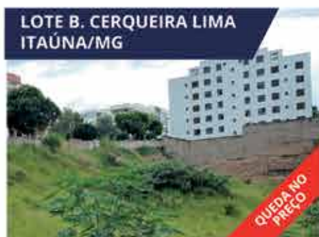
LOTE B. CERQUEIRA LIMA ITAÚNA/MG Lote com 408 m 2 no Bairro Cerqueira Lima, Itaúna, Rua Arnaldo Lima. R$ 320.000,00.