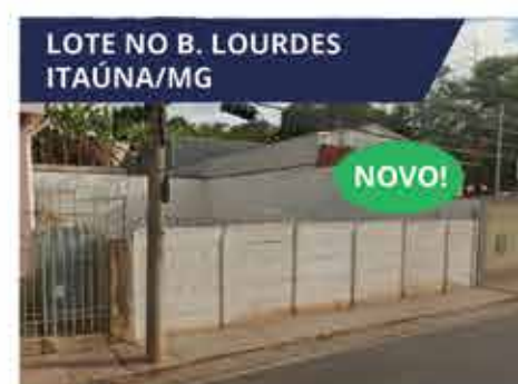
LOTE NO B. LOURDES ITAÚNA/MG Lote com 192 m 2 na Rua Sesostres Milagres, Itaúna/MG (Rua da Gruta). R$ 195.000,00.