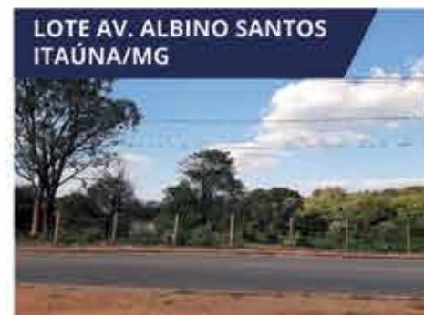
LOTE AV. ALBINO SANTOS ITAÚNA/MG Av. Albino Santos, S/N, em frente a Alaita, Itaúna. Área: 6317 m 2 R$ 1.899.000,00 / (R$ 300,00 o m 2 )