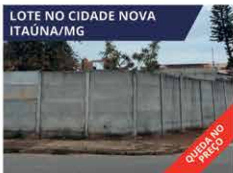
LOTE NO CIDADE NOVA ITAÚNA/MG Rua Vovó Benvinda de Souza, S/N, Cidade Nova Área: 430 m 2 R$ 160.000,00