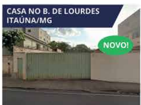
CASA NO B. DE LOURDES ITAÚNA/MG Casa com 110 m 2 e lote com 870 m 2 na Rua Dorinato Lima, Itaúna /MG. R$ 890.000,00.