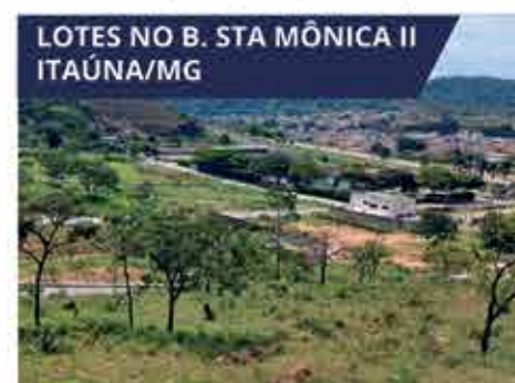
LOTES NO B. STA MÔNICA II ITAÚNA/MG Lotes em área mista para edificações residenciais e comerciais, como casas, prédios e galpões. A partir de R$ 106.200,00.