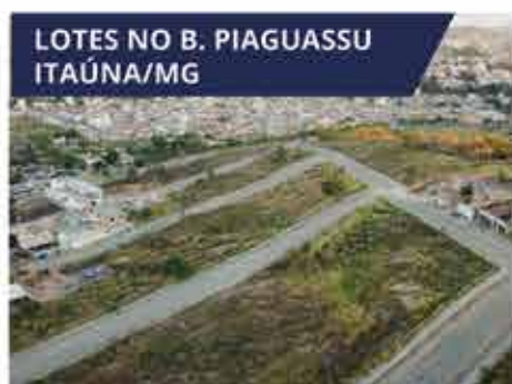
LOTES NO B. PIAGUASSU ITAÚNA/MG Lotes em área mista para edificações residenciais e comerciais, como casas, prédios e galpões. A partir de R$ 97.200,00.