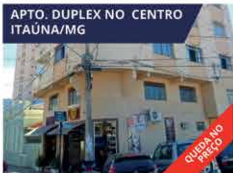
APTO. DUPLEX NO CENTRO ITAÚNA/MG Apartamento duplex com 286 m 2 na Praça Mário Matos, 347, Centro, Itaúna. R$ 299.000,00.