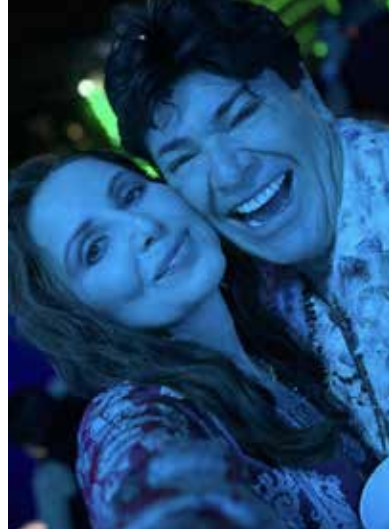
A maravilhosa Gy com Y e este colunista

LOJA DE MÓVEIS - Mal chegou na cidade, fez um alarde, pediu para euzinha ir lá, gravei vídeo, fiz merchandising na loja, reorganizei os móveis, panfletei, postei nas redes sociais e a loja fecha, me dando calote. Será que meu marketing foi fraco ou é a loja que era fraca nas vendas? Tô passada. Nem esquentou o lugar, não durou três meses. Chegaram com pose e saíram dando golpe. Trastes.