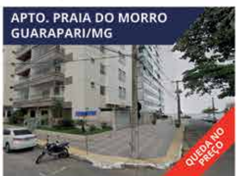
APTO. PRAIA DO MORRO GUARAPARI/MG Apartamento com 99 m 2 em Guarapari, 1 quarteirão da Praia do Morro. R$ 349.000,00.