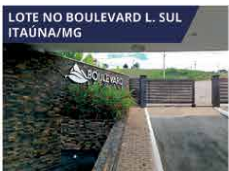
LOTE NO BOULEVARD L. SUL ITAÚNA/MG Lote com 484 m 2 no Condomínio fechado Boulevard Lago Sul (Área residencial). R$ 489.000,00.