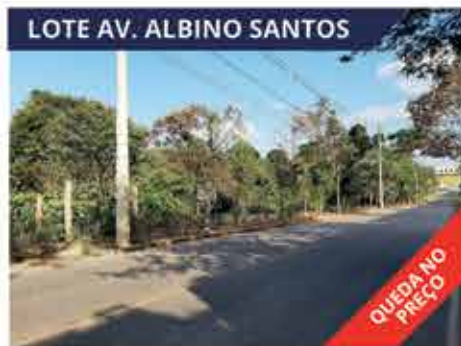
LOTE AV. ALBINO SANTOS Av. Albino Santos, S/N, Bairro JK, em frente a Alaita, Itaúna. Área: 3820 m 2 . R$ 799.000,00 / (R$ 209,00 o m 2 )