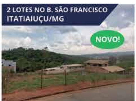
2 LOTES NO B. SÃO FRANCISCO ITATIAIUÇU/MG 2 Lotes com 360 m 2 cada um, na Rua São Caetano, Bairro São Francisco, Itatiaiuçu/MG. R$ 75.000,00 (Cada).