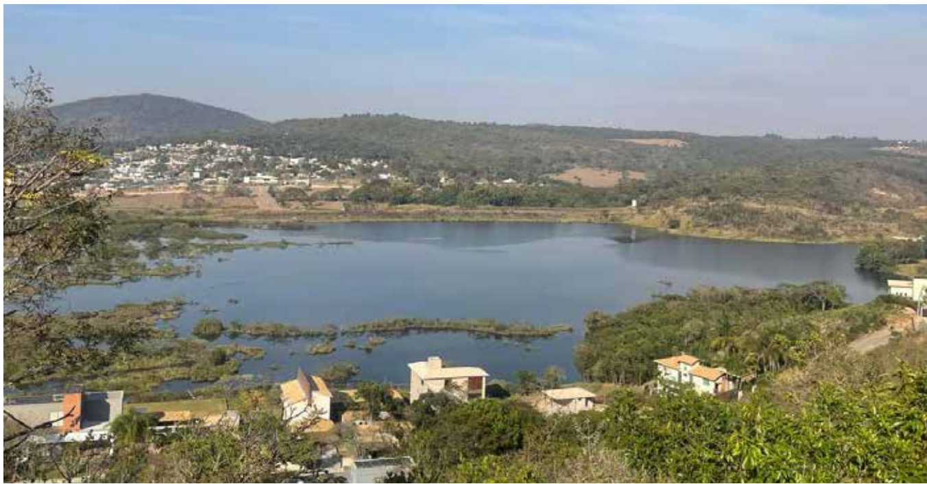
A situação para o SAAE de Itaúna

zido pela FIEMG, “é fundamental destacar que as restrições impostas pela Portaria IGAM nº 25/2025 podem ter um impacto direto no abastecimento público de alguns municípios dada a presença de outorgas concedidas à Companhia de Saneamento de Minas Gerais (Copasa) ou a serviços municipais de água (como os SAAEs da região)”. O primeiro efeito é na redução do volume de água captado nesses municípios, “sendo para cada finalidade um percentual a se reduzir e pode impactar no abastecimento público, já que concessionárias também terão que reduzir sua captação”, explicou o setor de análise ambiental da FIEMG Regional.